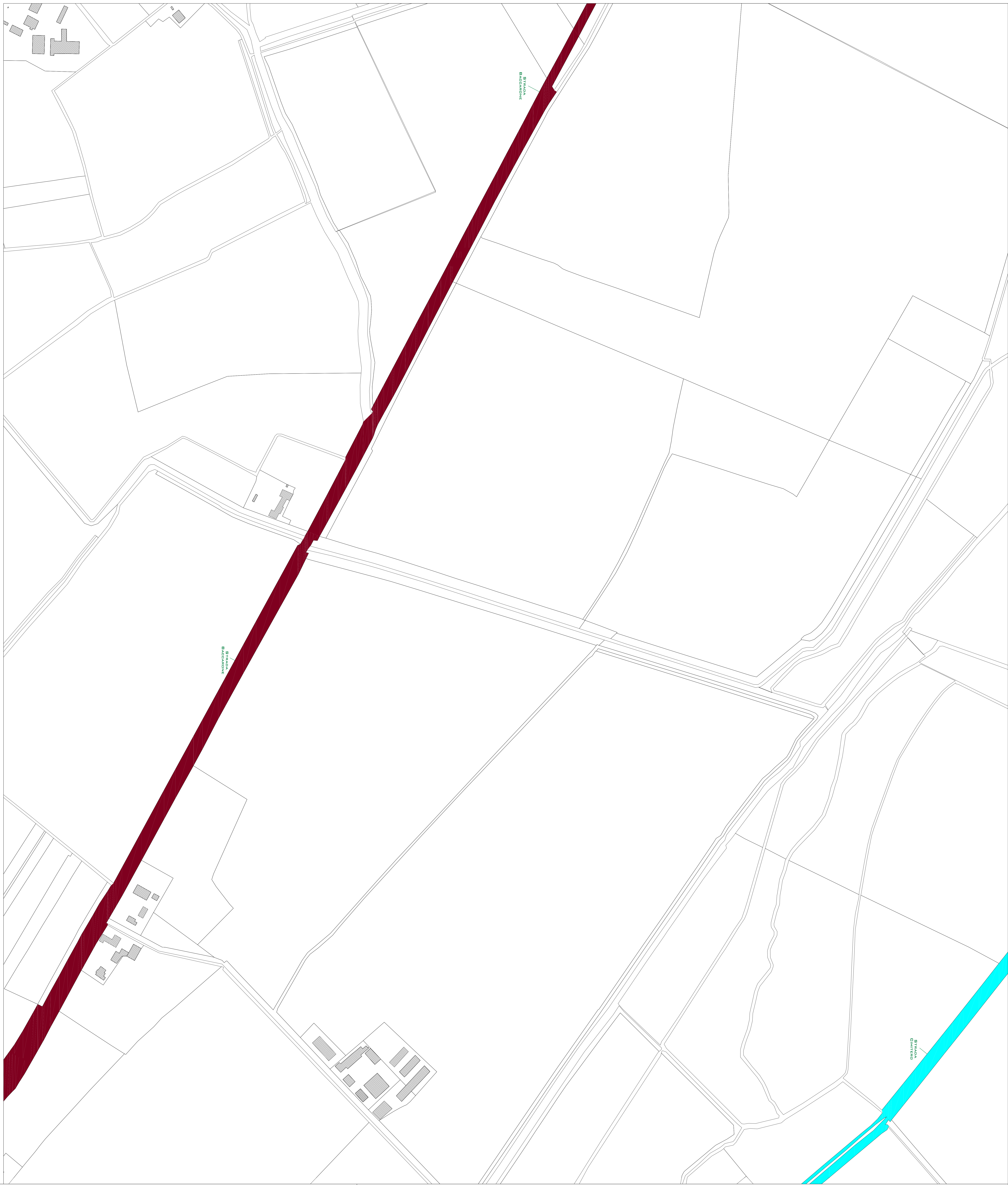
LEGENDA CLASSIFICAZIONE ILLUMINOTECNICA